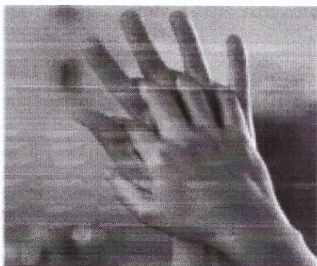
Стадия 3 Ладонь к ладони рук с перекрещенными пальцами