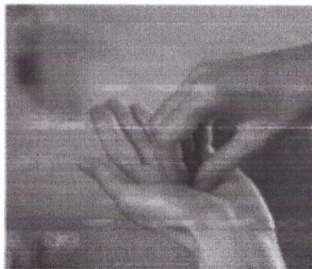
Стадия 6 Кругообразное втирание сомкнутых кончиков пальцев правой руки на левой ладони и наоборот