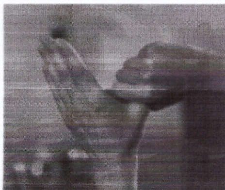
Стадия 5 Кругообразное растирание левого большого пальца в закрытой ладони правой руки и наоборот