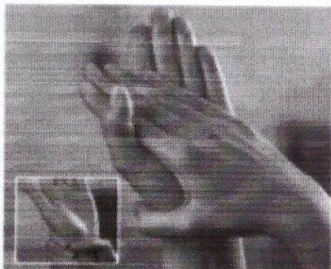
Стадия 1 Ладонь к ладони, включая запястье