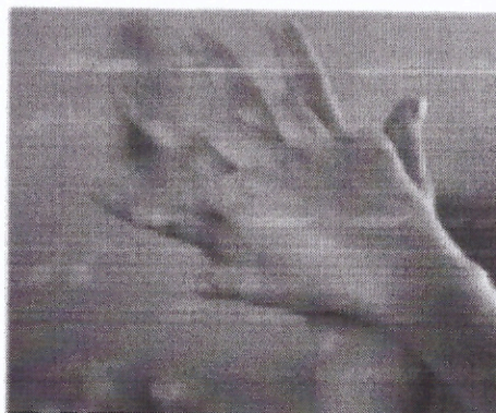
Стадия 2 Правая ладонь на левую тыльную сторону кисти и левую ладонь на правую тыльную сторону кисти